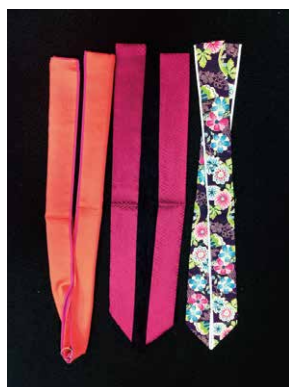
重ね衿 かさねえり