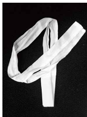
三重帯紐 さんじゅうおびひも