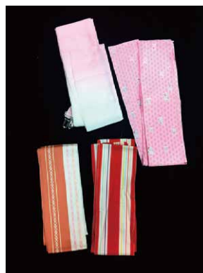
伊達締め だてじめ