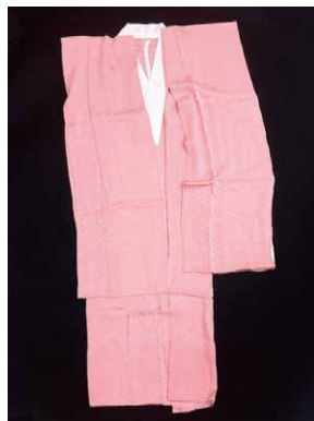
長襦袢 ながじゅばん