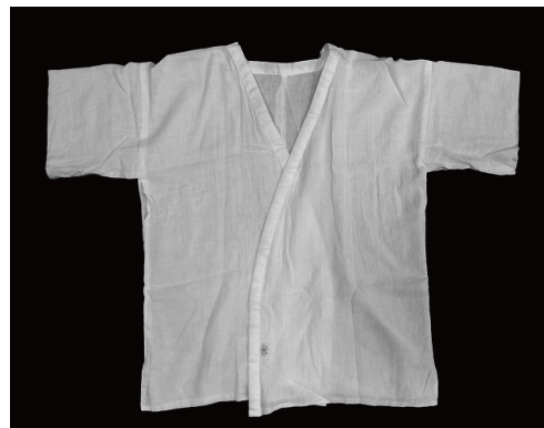
肌襦袢 はだじゅばん