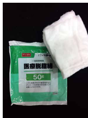
脱脂綿 だっしめん