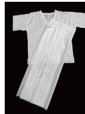
肌襦袢と裾よけ はだじゅばんとすそよけ