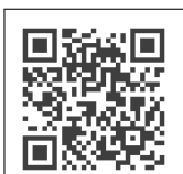
携帯 QR コード